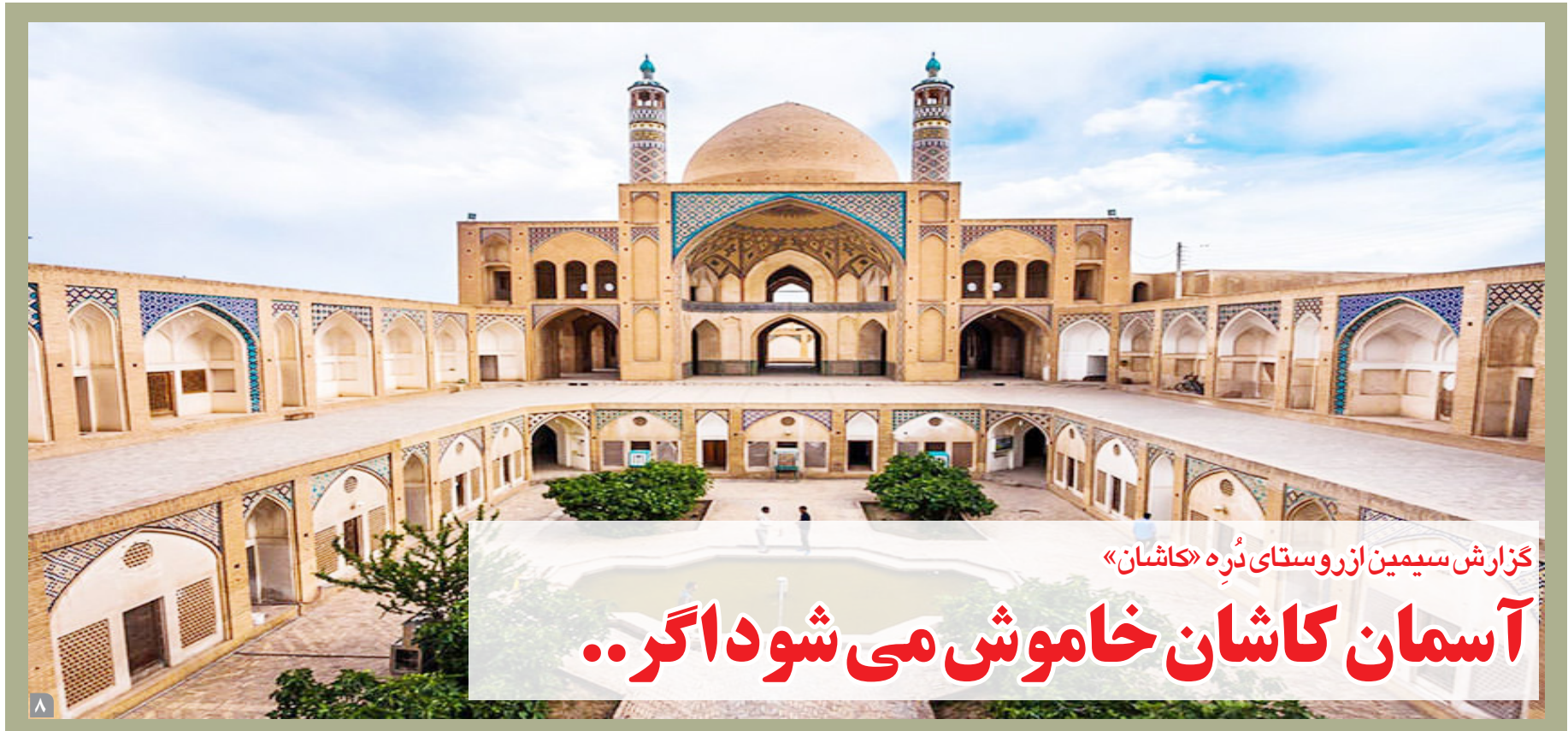
گزارش سیمین از روستای دره «کاشان»